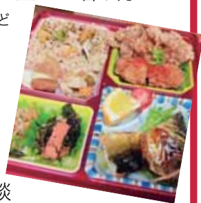
当日の内容とは異なります。