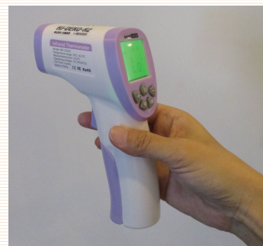
非接触式体温計にて検温を行います

スタッフから受診者様への飛沫感染が起こらないよう、 受付に保護用の透明シートを設置しております。