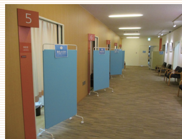
検査室入口にパーテーションを設置しております

待合の椅子やテーブル、ドアノブ等、皆様の手が触れる部分は定期的にアルコール消毒を行っております。