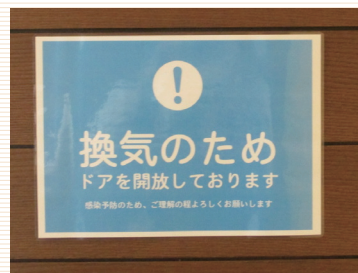
ドアを開放し換気をしております

開放できるドア、窓は開け、外気を取り入れ空気を循環させております。 また、一部の検査室や診察、結果説明室のドアを開放しております。 入口へのパーテーションの設置など、対応策を実施しております。